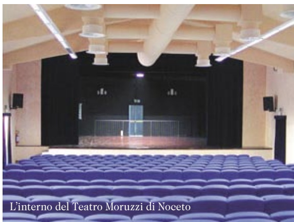
L'interno del Teatro Moruzzi di Noceto

INFO E PRENOTAZIONI: tel. 389.9690904 347.1110917 347.1832049, info@edizionezero.it web: www.edizionezero.it